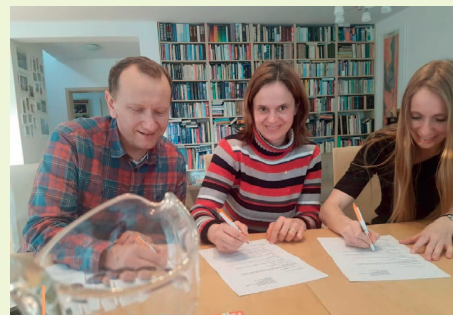
Slávnostný podpis vzniku združenia Cesta von