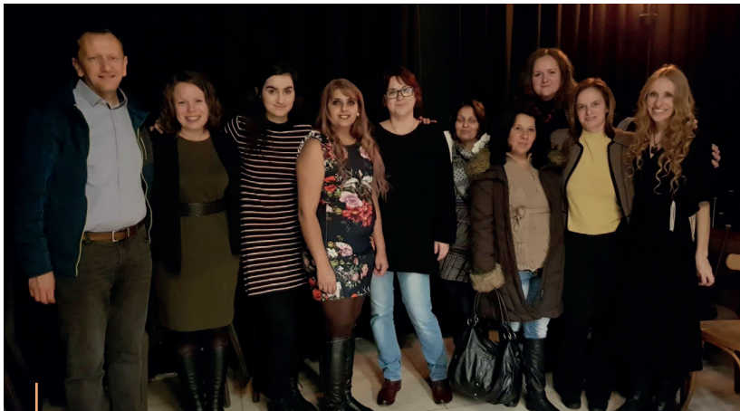
Cesta von na decembrovom stretnutí s darcami v Klube pod lampou