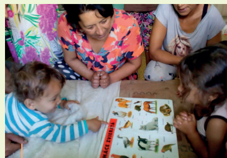
Rozbeh lekcí v domácnostiach