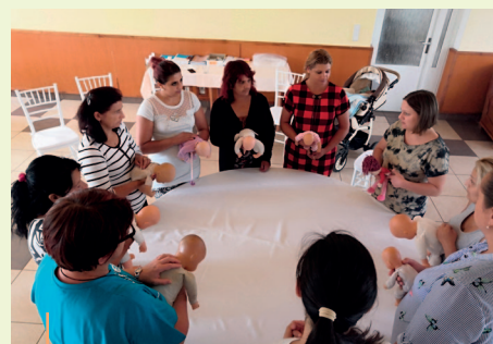
Prvý tréning omám a mentoriek v Dargove